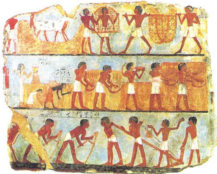
A paraszti élet jelenetei (Kr. e. 1400 körül), falfestmény

A sávos ábrázolás alkalmas volt arra is, hogy egy eseménysor különböző időszakban történő jeleneteit egy képbe sűrítsek. A korábban zajló cselekmények az alsó sávba, a későbbiek pedig egyre magasabb sávba kerültek.