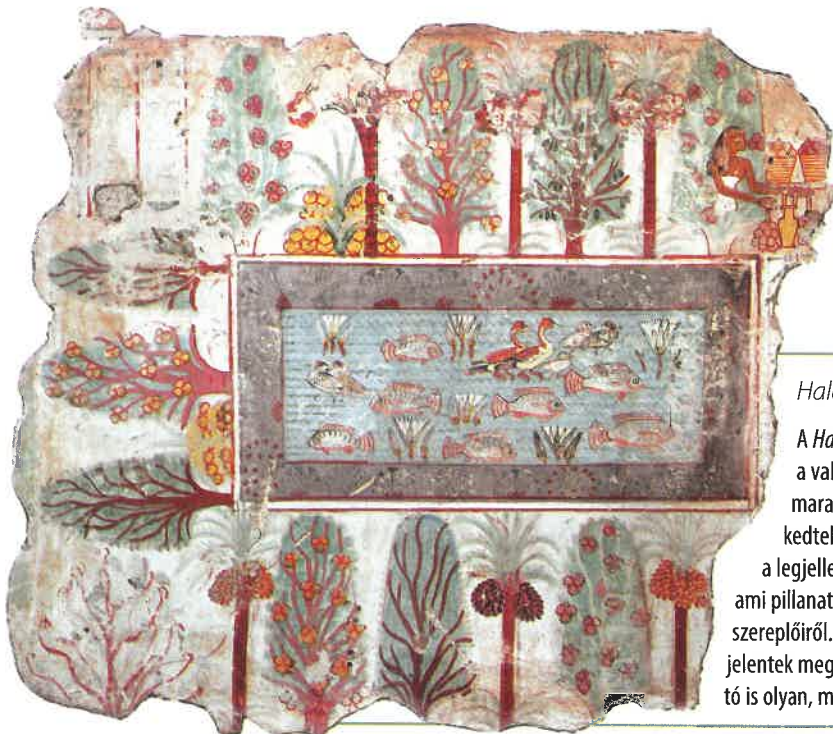
Halastó (Kr. e. 1400 körül), thébai falfestmény

A Halastó című festményen jól látszik, hogy az egyiptomiak nem a valóság pontos utánzására fektették a hangsúlyt. A művészek a maradandóságra, a dolgok változatlanságának bemutatására törekedtek. Az ábrázolás szigorú szabályait követve mindig a lényeg, a legjellegzetesebb részleteket örökítették meg. Nem azt mutatták be, ami pillanatnyilag látható, hanem azt, amit tudni kell a témáról és annak szereplőiről. A festményen a jellemző nézeteik szerint, azaz oldalnézetben jelentek meg a fák, a halak, a madarak, és a szabályos téglalap alakú halastó is olyan, mintha pont felülnézetből látnánk.