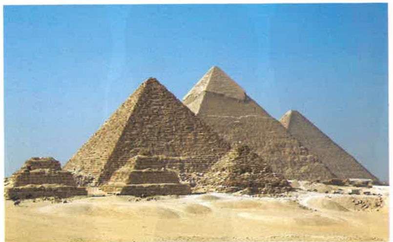
A gízai piramisok: az előtérben Mükerinosz, középen Khephrén, a háttérben Kheopsz fáraó piramisa

Óriási megtiszteltetésnek számított, ha valaki a fáraó piramisa mellé építhette sírhelyét. Számára ez azt jelenthette, hogy megoszthatta az örök életet a fáraóval.