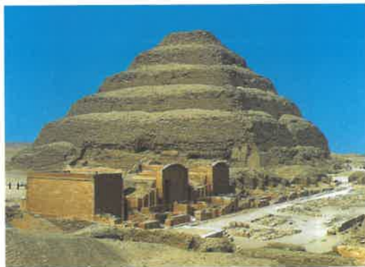
Imhotep: Dzsószer fáraó lépcsős piramisa (Kr. e. 2650 körül), Szakkara

Az uralkodók és az előkelők sírépítményei a maradandó anyagból épült, hatalmas méretű masztabák és piramisok voltak. Az egyszerű emberek földbe vájt sírba temetkeztek.